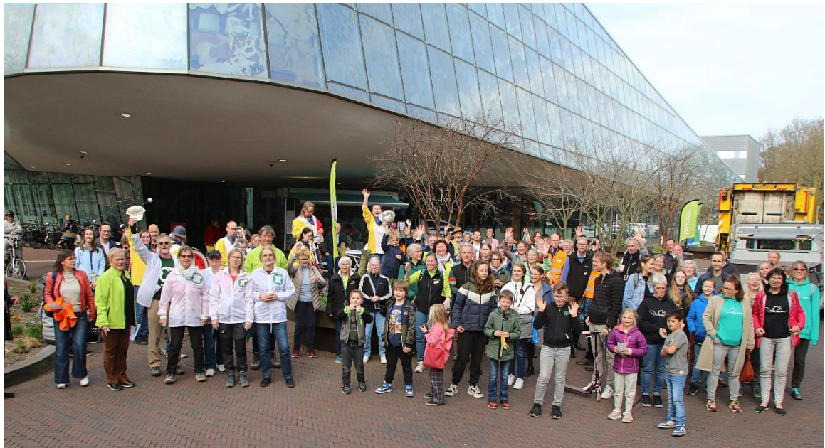
IVN ruimt met vrijwilligers 173 kilo zwerfafval op in centrum Alphen aan den Rijn