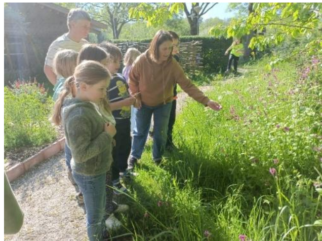
Activiteit mei 2025: eten uit de natuur

In 2025 hebben 10 Fladderaars-activiteiten plaatsgevonden. In januari kropen de kinderen in de huid van dieren om te ontdekken wie wie eet. Daarna weer een heel ander thema: "recyclen". Maart stond in het teken van knotten en zagen met de werkgroep Vrijwillig Landschapsbeheer. Natuurlijk werden er weer worstjes met deeg verwarmd. In april waren we bij plantencentrum Esveld te vinden met een speurtocht en in mei hebben we allerlei recepten met ingrediënten uit de natuur gemaakt. hebben we figuren van takken en ander "afval" uit de natuur gemaakt. De eerste helft van het jaar werd sportief afgesloten bij poldersport Verhaar. Tot slot hielden we nog een picknick voor kinderen en ouders.